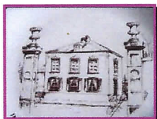
Villa Decker, Millewee Dessin : J.P. Beffort