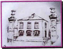
Villa Decker, Millewee Dessin : J.P. Beffort